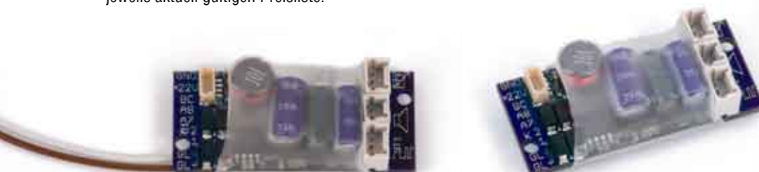
eMOTION S - serienreifes Handmuster (in Originalgröße 5+35+5 x 20mm) eMOTION S - prototype ready for mass production (original size 5+35+5 x 20mm)